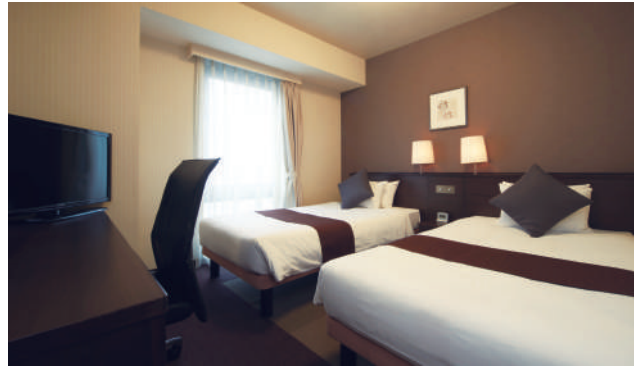
TWIN ROOM ツインルーム 12室