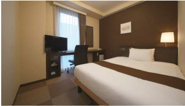
SINGLE ROOM シングルルーム 93室