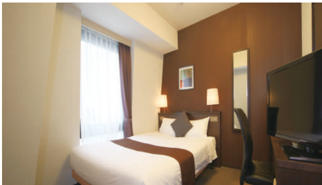
DELUXE ROOM デラックスルーム 1室